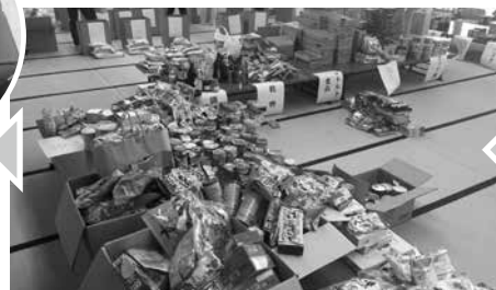
種類ごとに整理されていきます