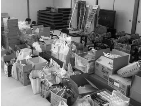
本当にたくさんの善意が集まりました!

6月22日(月)〜26日(金)において、コロナ禍で生活にお困りの世帯の方々のために、緊急食料支援(フードドライブ)事業として、食料等の寄附を募ったところ、県内各地にお住まいの方々から、心あたたまるお言葉と共に、たくさんのご寄附をいただきました。 また、日頃から様々なボランティア活動をされている方々が、いただいた食料品を仕分けして下さい、約70世帯の方々にお届けすることができました。 ご協力いただいた皆さま、本当にありがとうございます。今後も状況を見て、支援を継続していきまします。引き続きご協力のほどよろしくお願いいたします。