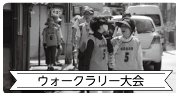
ウォークラリー大会