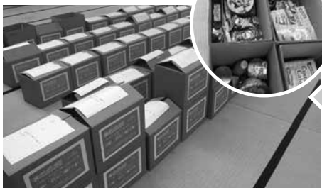
お届け箱に丁寧に詰められた支援品