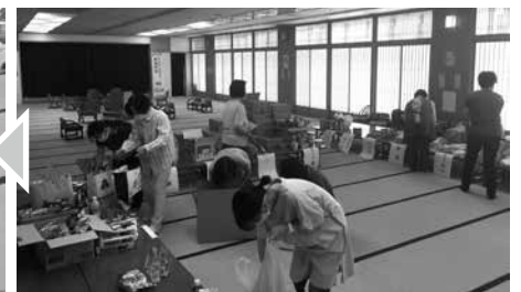
ボランティアの方々による仕分け