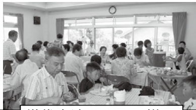
世代交流サロンの様子