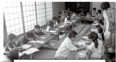
夏休み子ども教室