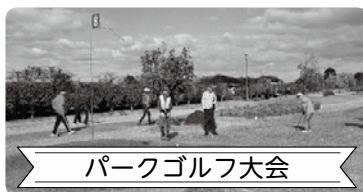
パークゴルフ大会